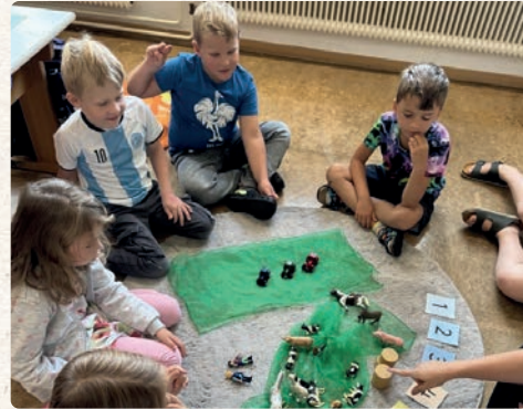
Einblick in den Unterricht der 1. Stufe (li.)