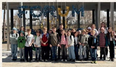
Auf dem Programm standen u.a. der Besuch des Klangturms, des Landhauses sowie eines Museums und eine Stadtführung, bei der die Kinder viel über die Landeshauptstadt erfahren konnten.

Ein weiterer Höhepunkt war die Exkursion der 3. und 4. Schulstufe nach St. Pölten.