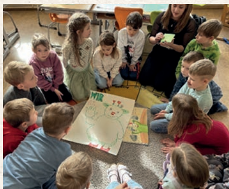
Durch Spiele und kleine Aufgaben werden wichtige Vorläuferfertigkeiten geübt und die Kindergartenkinder gewinnen erste Eindrücke vom Schulalltag.

In den vergangenen Wochen war an der Volksschule einiges los. Mitte Jänner fand die Schuleinschreibung für zukünftige Erstklässler:innen statt. Bei den regelmäßig stattfindenden Schulvormittagen können die Schulanfänger:innen Schulluft schnuppern.